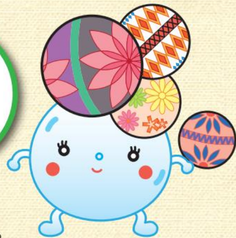
出雲崎町デマンド交通 イメージマスコット 「てまりん」