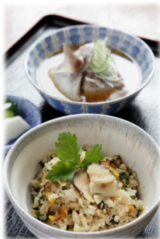
サザエの炊込みご飯