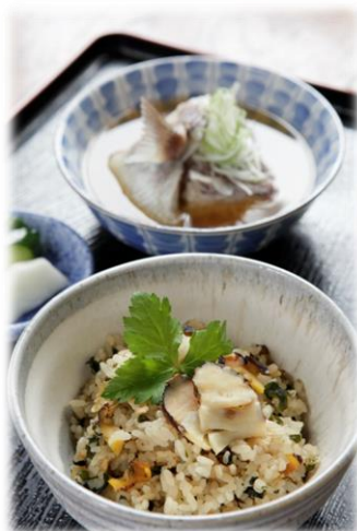
サザエの炊込みご飯