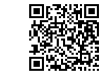
出雲崎町観光協会QRコード