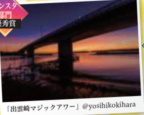
「出雲崎マジックアワー」@yosihikokihara