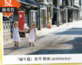
「掃り道」新井 勝義 (新潟県加茂市)